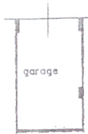
PIANO SEMINTERRATO H=2.55